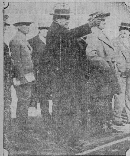
Aquí vemos al ex-presidente de México, Lic. Portes Gil, ejerciéndose en el manejo de la pistola, bajo la dirección de los oficiales de la guardia presidencial