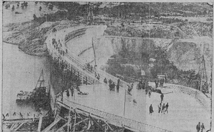
Esta enorme presa, construida en Maratón, Grecia, es obra de ingenieros norteamericanos y está destinada a proveer la cañería de Atenas