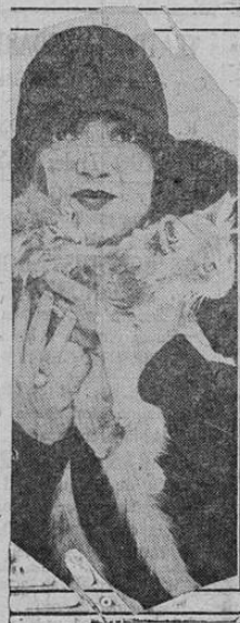
La cantante de ópera Rosa Ponselle acaba de llegar a N. York, después de unas vacaciones en Italia, y trayendo como compañeros los señores Totó y Tito